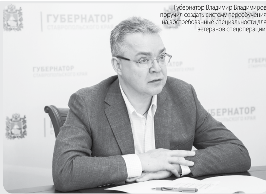
Губернатор Владимир Владимиров поручил создать систему переобучения на востребованные специальности для ветеранов спецоперации.

Также стоит отметить, что в сельхозхозяйственных организациях края приступили к заготовке грубых и сочных кормов. В сельхозорганизациях заготовлено сена 0,25 тыс. тонн и сенажной массы 33,8 тыс. тонн.