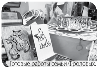
Готовые работы семьи Фроловых.

Николай Николаевич также отметил, что в этом году заключили социальные контракты уже более 100 человек, у каждого из них свои увлечения, которые интересны не только им, но и жителям всего Предгорья.