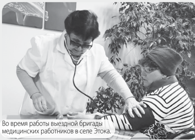
Во время работы выездной бригады медицинских работников в селе Этока.

Выезд мобильной врачебной бригады в рамках регионального проекта «За здоровье» состоялся в село Этока.